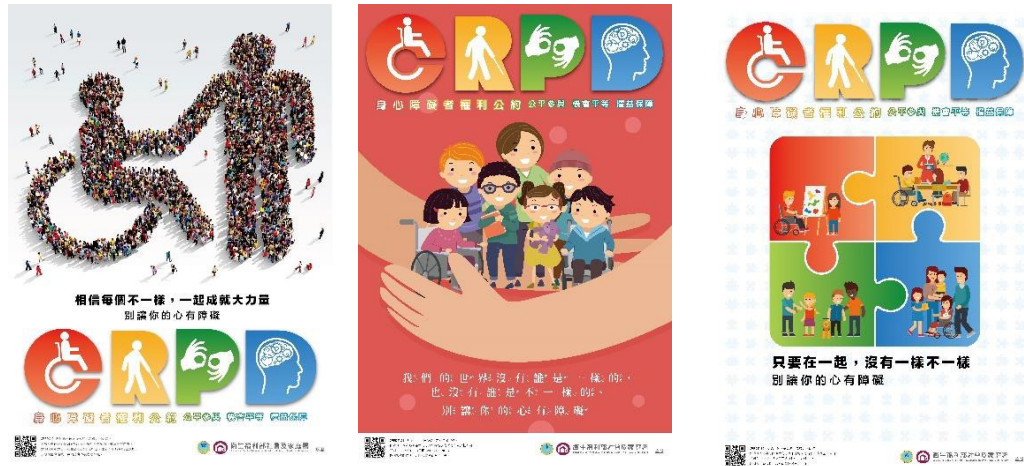
● 圖 1-3 給不同年齡層的宣傳海報