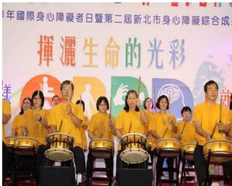
● 圖 1-1

並可以宣傳 CRPD 的重要性，讓民眾知道什麼是 CRPD？一方面又可以為本組織樹立起關心社會公益事業、具有高度社會責任感的良好形象。