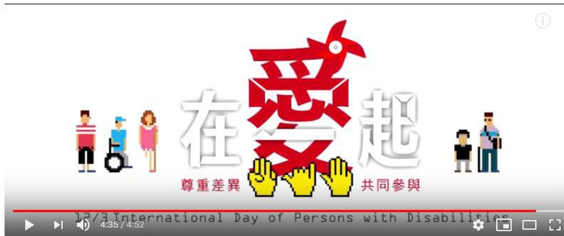
2016國際身心障礙日宣導微電影

把真實發生在身心障礙者身上的事件利用微電影的方式向大眾宣傳，藉由影片傳達身心障礙者的需求與感謝，讓愛與感恩透過微電影傳播社會的每一個角落!!