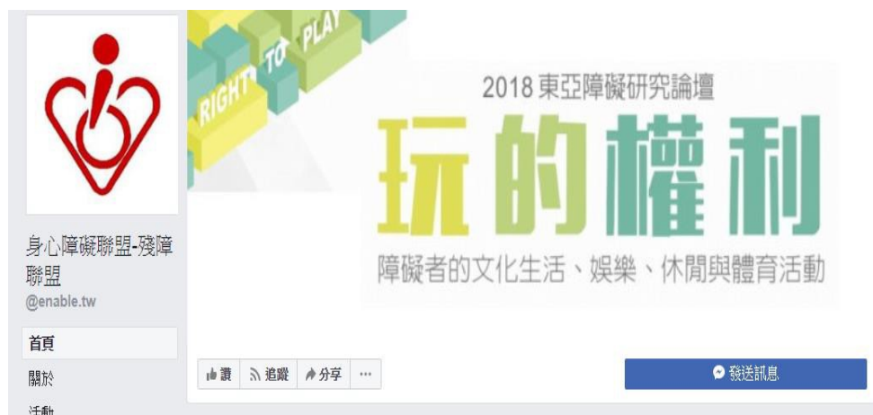
● 圖 1-2 身心障礙聯盟粉絲專頁

現代人不再像以前一樣閱讀報章雜誌來獲取新知識，而是使用網際網路、社群軟體來接收新知識，反觀若要讓民眾更加了解 CRPD 運作現況，我認為可以使用社群軟體來讓民眾了解 CRPD 是什麼？並且也可以隨時更新 CRPD 的近況。