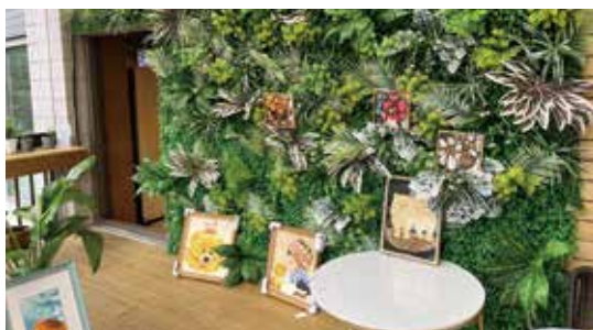
會場以庭院式森林創意展現