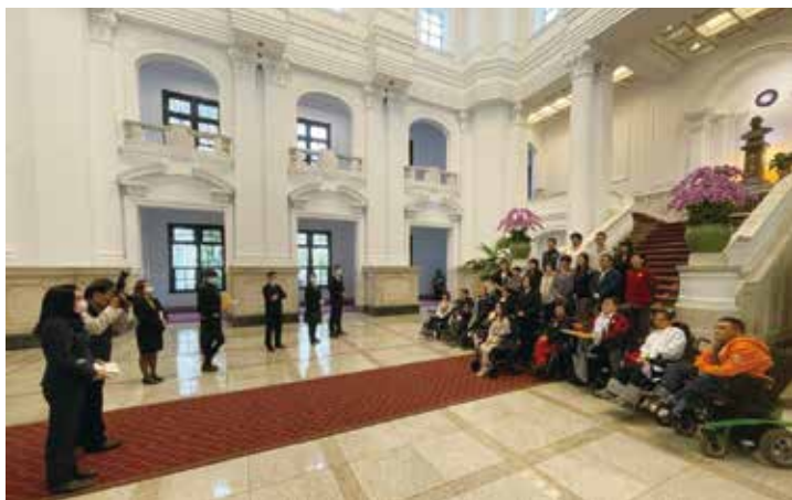
參訪總統府並 與蔡英文總統 拍照合影

設計完後就到環球召開說明會，來參加的同學大多是重度障礙的同學居多，我自己也找了個人助理一同前往，分享的過程和個人助理互動及協助，啟發學生的好奇，也發現學生們對於無障礙交通、個人助理、獨居生活，有很多的提問，顛覆現有生活的想像。