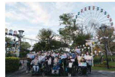
兒童樂園無障礙體驗合照

由於疫情肆虐，只能透過線上來討論，並且是學生社團活動及暑假期間討論何謂自立生活；我們有幾個主要討論，大則《身心障礙者權利公約》、《身心障礙者權益保障法》及自立生活、無障礙環境及社會制度的重要，小到如何過馬路、購物、溝通、穿著，都有相關工作坊及討論，還另外開 google meet 的使用課程，讓大家玩得不亦樂乎。