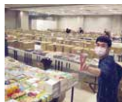
感謝山城二手書店老板及其好友來幫忙台北書展上書

感謝首都藝術中心提供老頑童畫家劉其偉岩雕畫作品，其畫如其人，野性豪放自由純真自然美，書展義賣大家不要錯過！