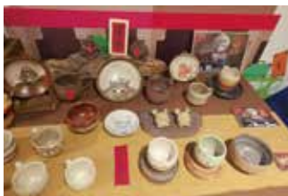
樂融柴燒陶藝作品

本會第 3 次董事會移師到新竹開會，董事們也蒞臨書展為公益添磚加瓦。這次書展，許多光臨會場的客人在自己新竹社區社團不斷為我們發消息，締造了 6+ 購物廣場難得的好業績！在此深深感恩這些朋友的情深義濃！