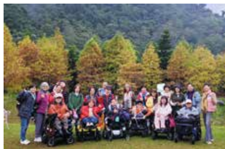
南庄雲水渡假村落羽松