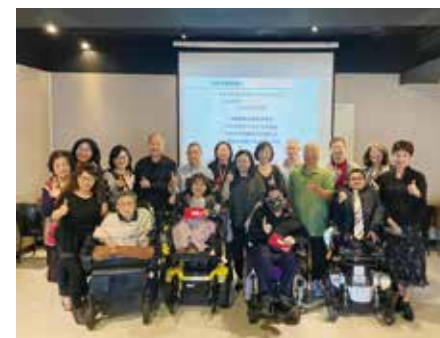
公益團體代表與貴賓及董事們合照

12/04「認養優質公益團體」結報，共協助 4 個社團法人團體，每個團體頒贈新台幣 3 萬 6,000 元整。