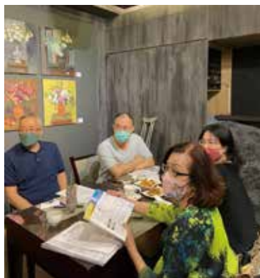
第 12 屆第 4 次董事會～決審鄭豐喜獎學金 (111.11.04)