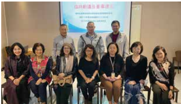
第 12 屆第 5 次董事會董事合照