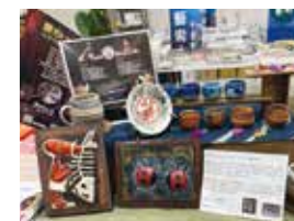
劉其偉作品岩雕畫