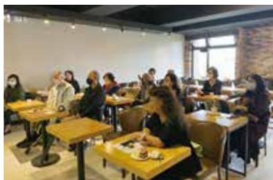
董事及貴賓蒞臨會場

鄭豐喜基金會於 12/04 在伯朗咖啡中山二店 5 樓（台北市中山區中山北路三段 6 號）舉行「感恩獎・破浪勇者獎」表揚典禮，邀請貴賓、歷屆破浪勇者、本會董事們觀禮。