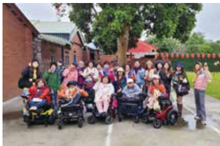
頭份蘆竹瀆古厝漫遊