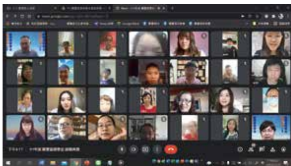
參加線上頒獎典禮的同學及董事們