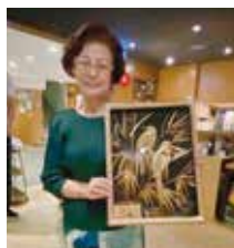
義賣會中貴賓愛心不落人後踴躍認購。