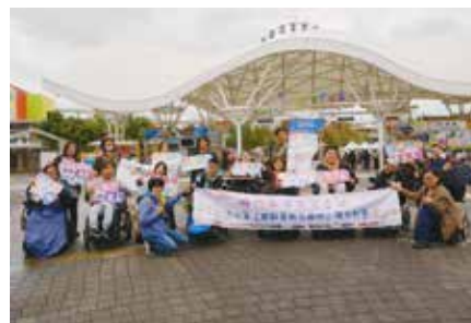
兒童樂園無障礙體驗合照