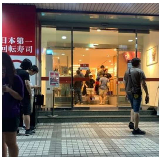
店家門口無斜坡或身降梯

儘管台灣在推動環境無障礙方面取得了進展，但仍然需要更多的努力來克服上述不足之處，以確保所有社會成員都能享有平等的機會和權益。推動環境無障礙應該從新世代障礙者的角度出發，考慮到他們特殊的需求，以確保社會的進展不僅止於表面，還真正反映在每個人的生活質量上。