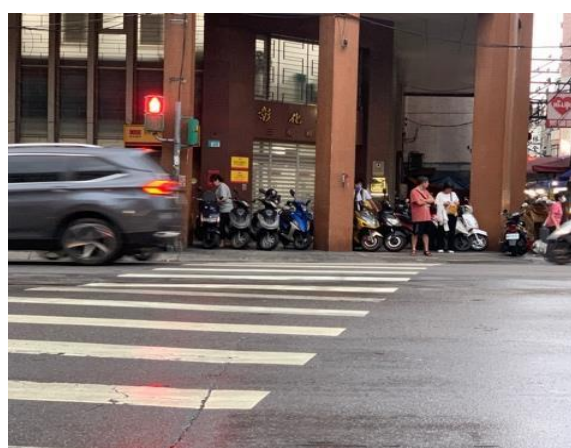
人行道出入口停放摩托車