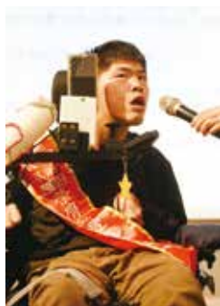
論文獎得獎代表方正法同學致詞