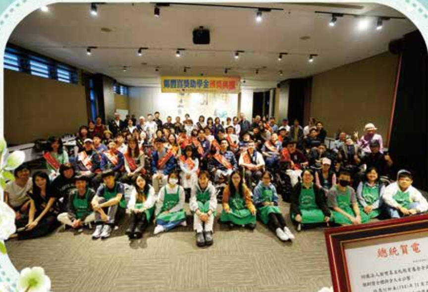
114 年度「鄭豐喜獎學金」頒獎典禮大合照