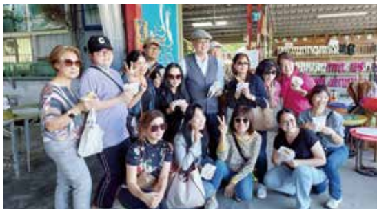
華山社友與本會董事拿著自製的蔥油餅，開心合照。