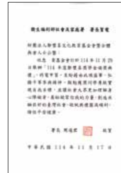
衛生福利部社會及家庭署 周道君署長賀電