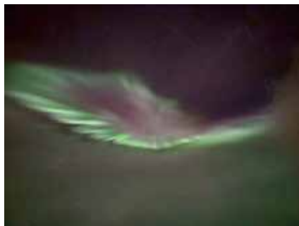
冰島極光如夢似幻

九月的冰島天氣稍微有些寒冷，尤其是在晚上追極光的時候，冷風呼嘯而過，即便是不怕冷的我，也感覺到寒氣刺骨，所有能抵禦寒冷的物品如帽子、圍巾、手套和暖暖包，一樣都不能少，住在民宿的時候，甚至裹著棉被到戶外，只為了能一睹極光的美景。這次在冰島的十幾天中，幸運地有五個夜晚都能看到如夢似幻的極光，眼睛所見的光是那麼淡雅，但透過相機卻呈現出多彩的色彩，時而如絲帶般輕輕飄動，時而又猛烈舞動，那一刻真的感到視野大開，無比震撼，深刻體會到，大自然並不需要刻意安排，便足以令人感動。