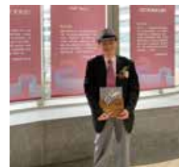
榮獲 2025 台灣文學獎台語文學創作獎 - 小說首獎。