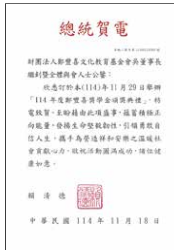
總統府 賴清德總統賀電