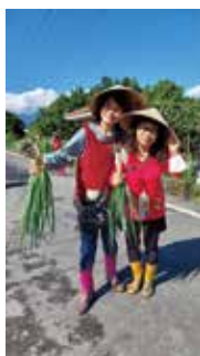
下田挽蔥，採蔥當蔥農。