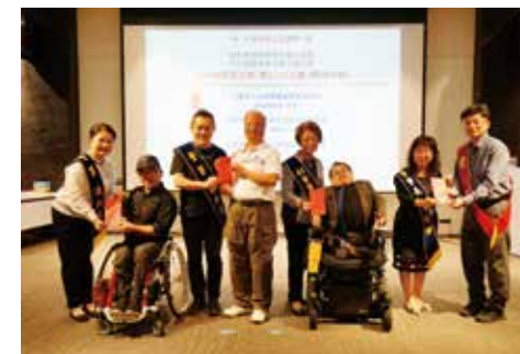
董事們共同頒贈認養金給優質公益團體。 從左至右：新北市身心障礙者體育運動總會代表、 台北市行無礙資源推廣協會代表、台北市新活力自 立生活協會代表、台灣障礙者權益促進會代表。