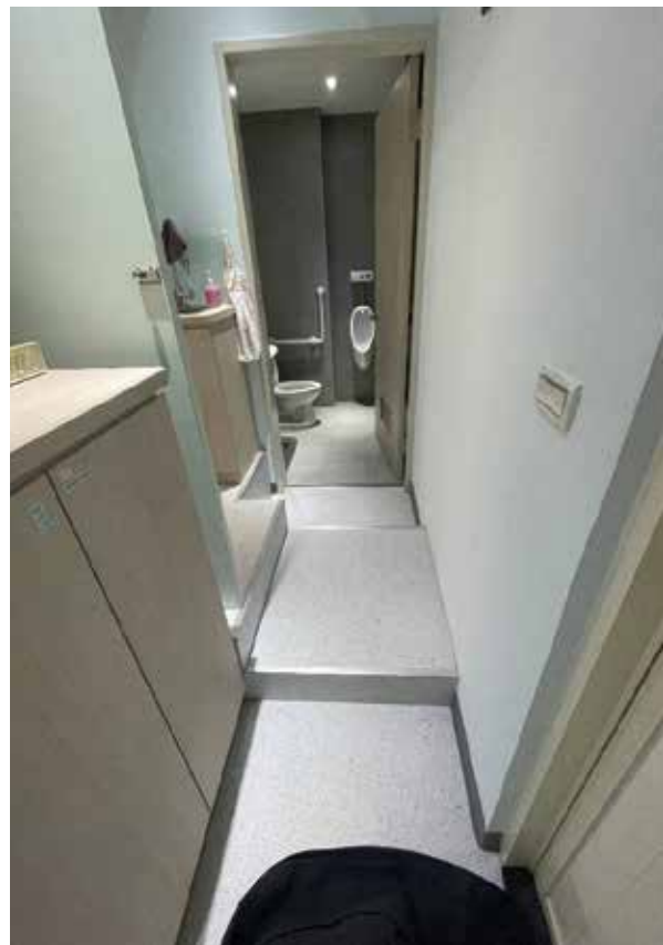
基層醫療診所內通道障礙。

最後，試問中央政府何時才會面對落實本案？又有何相對應的政府預算政策介入？以改善及消除全國的基層醫療診所障礙事，提升地方醫療環境設施品質。