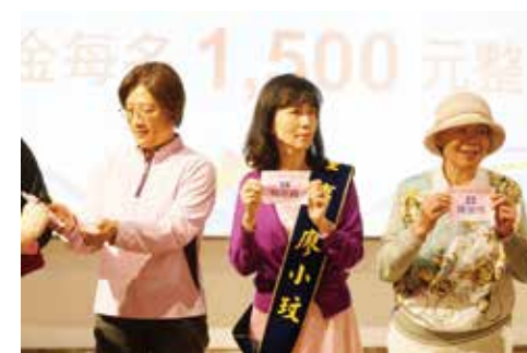
邀請董事及貴賓為同學們抽獎。