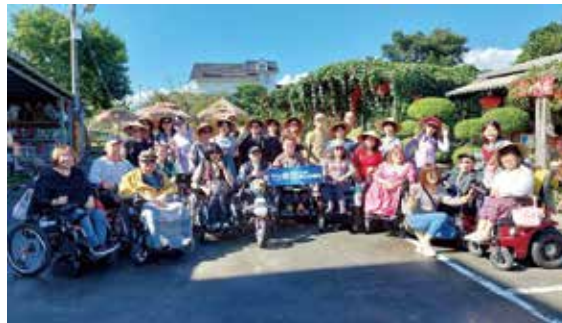
宜蘭農夫青蔥體驗農場合照。