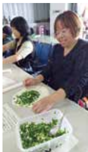
動手做蔥油餅，成就感滿滿。