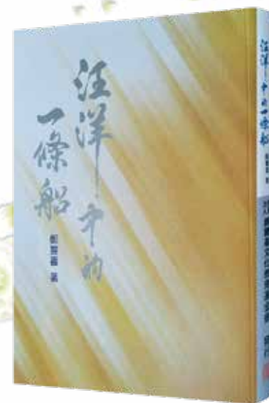
本會 40 周年紀念版 《汪洋中的一條船》原著