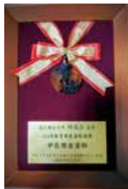
榮獲 114 年教育部友善校園獎中區傑出導師。