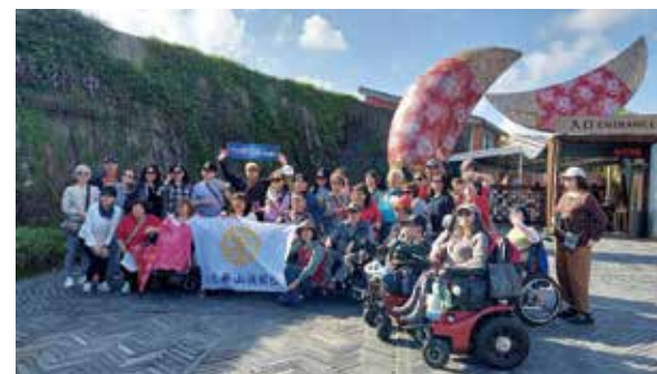
夥伴們一起在宜蘭傳藝中心前合照。