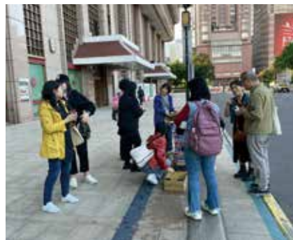
華山社好友準備早餐及飲料分享給大家。

我們首先到達宜蘭農夫青蔥體驗農場，看台上農場達人一步步地引導如何製作蔥油餅，大家親自動手完成，成就感滿滿。