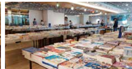
114 年度鄭豐喜新竹場義賣書展。

114 年度台北義賣書展一直尋不到合適的場地，因此台北義賣書展停辦，讓許多北部好友感到遺憾。