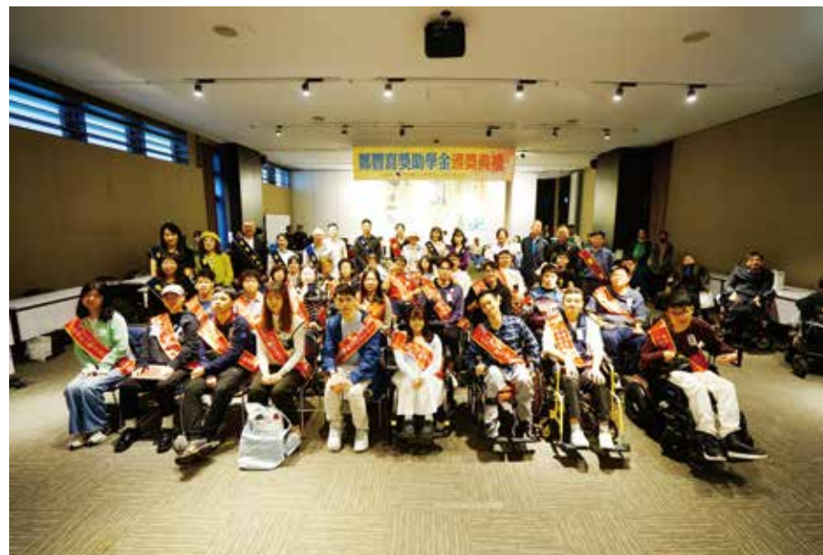
得獎同學與董事、貴賓合照