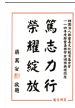
臺北市府 蔣萬安市長賀電