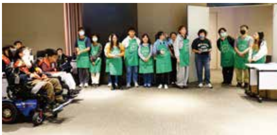
義工小天使等待任務中。