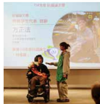
方正法榮獲「社福論文獎」特優獎